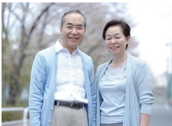
(参考書籍 nico 2016年9月ク インテッセンス出版株式会社)

思い当たる方は、快適な生活を送 るためにも、 入れ歯の調整や新調を 検討 してみてください。